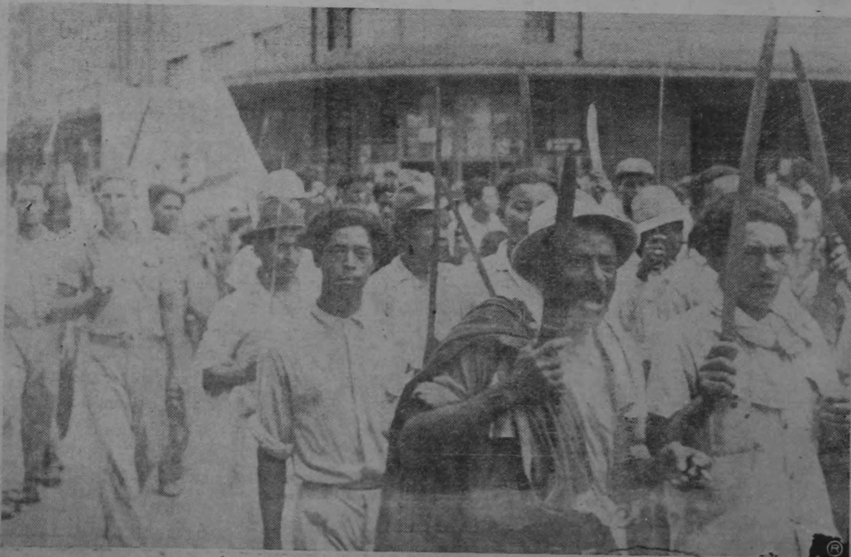
Con machetes en la mano, llenos de alcohol y odio, las huestes calderonistas y comunistas aterrorizaban San...

Los pobres por sus dirigidos entrenarse p ses. Más de con sus