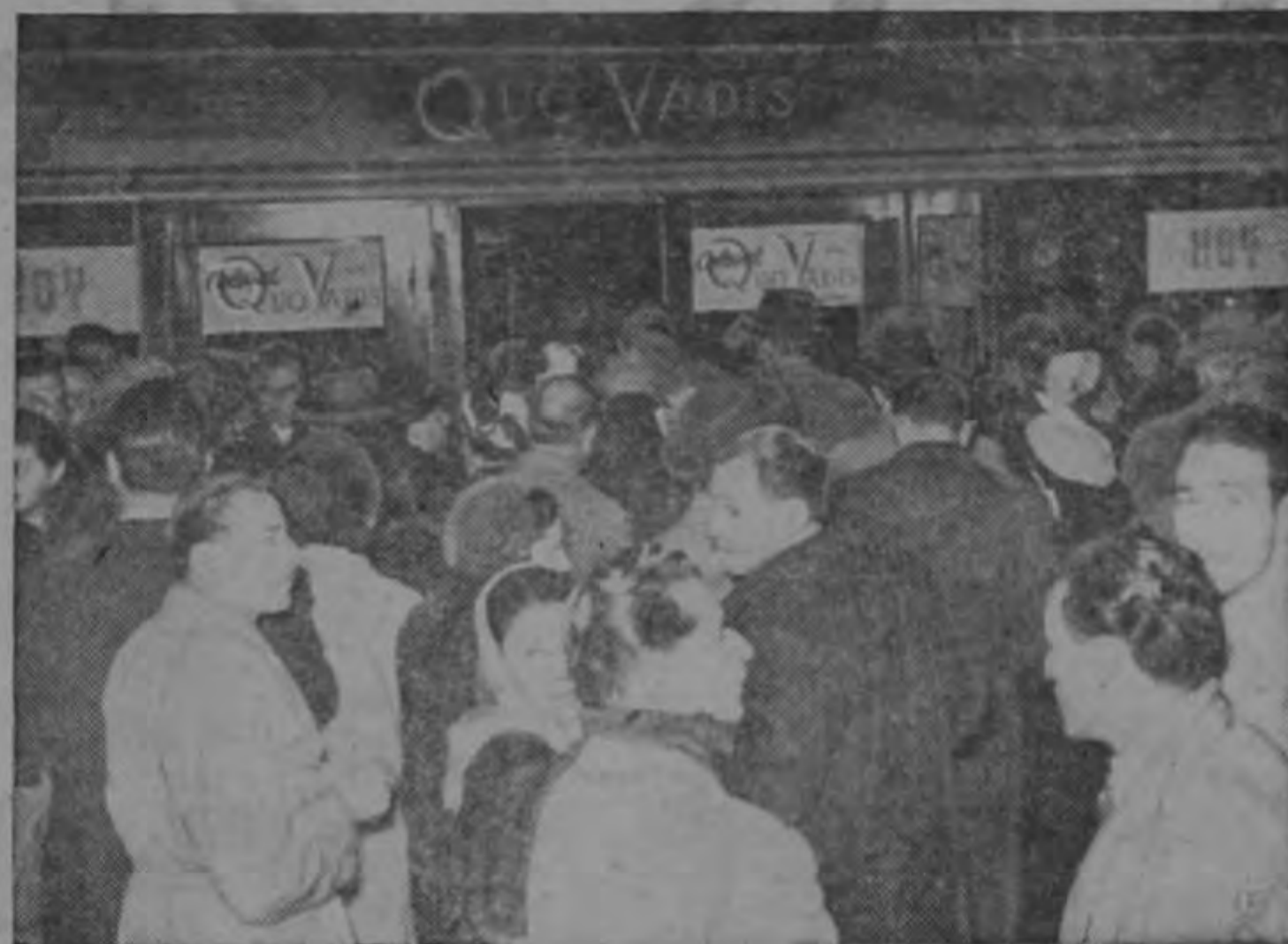
La multitud se agolpa en las taquillas para asistir a la premiere de una película americana en Uruguay.