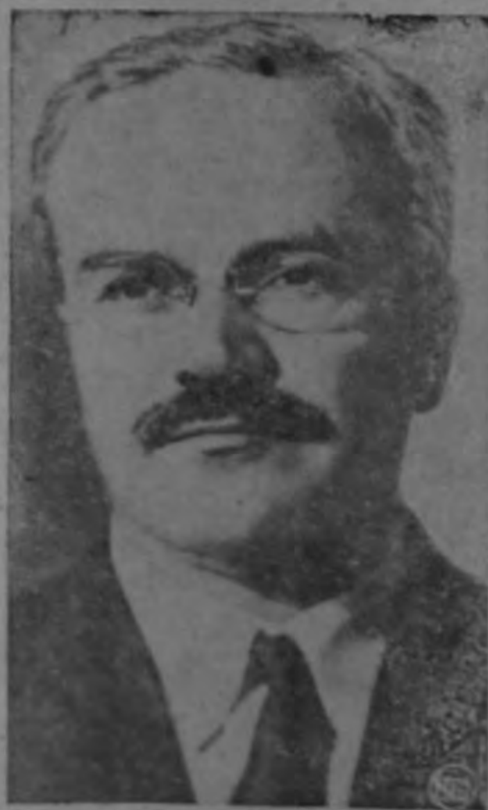
Viascheslav Molotov U. S. S. R.

En su carácter de Vice-Premier, Viascheslav Molotov asumió el Poder automáticamente, apenas se hizo el anuncio oficial del fallecimiento de Stalin. - Se presume - que Molotov solo estará temporalmente al frente del Gobierno, hasta que el Consejo de Comisarios y la dirección del Partido Comunista designen al sucesor. Es posible, sin embargo, que Molotov haga esfuerzos por mantenerse en primer plano.