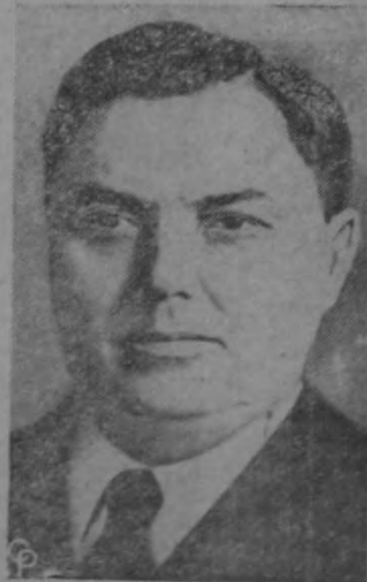
Georgi M. Malenkov

Georgi Malenkov está considerado como el más probable sucesor de Stalin, de quien alguna vez fué Secretario particular. En la actualidad, Malenkov tiene el más alto cargo político del Partido Comunista Ruso, como Secretario General. Siempre ha sido uno de los más activos propulsores del armamentismo soviético, y en general se considera que si el Poder le fuera confiado, las posibilidades de entendimiento entre oriente y occidente serían aun más remotas.