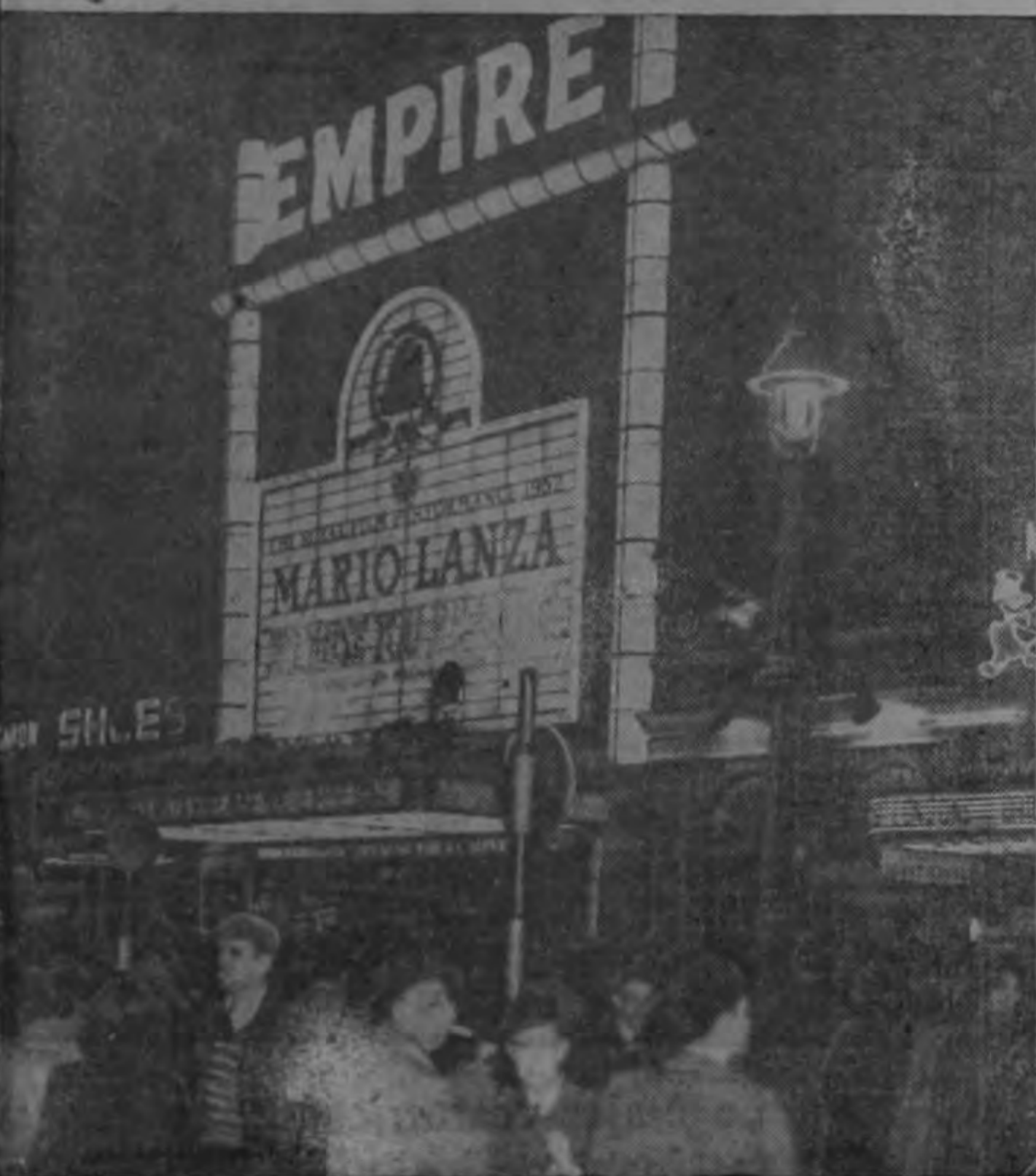
Una función de cine a la Realeza, con películas americanas, constituye todo un evento en Londres.

Pero siendo un maestro en el arte de agradar a todo el mundo, Hollywood cree que tiene grandes posibilidades de vencer cualquiera tormentas que encontrara en su camino.