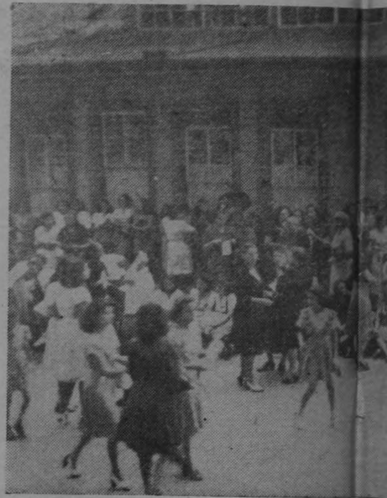
La mujer costarricense, en una gran cantidad de gestos innecesarios, y los sicarios los ultr...