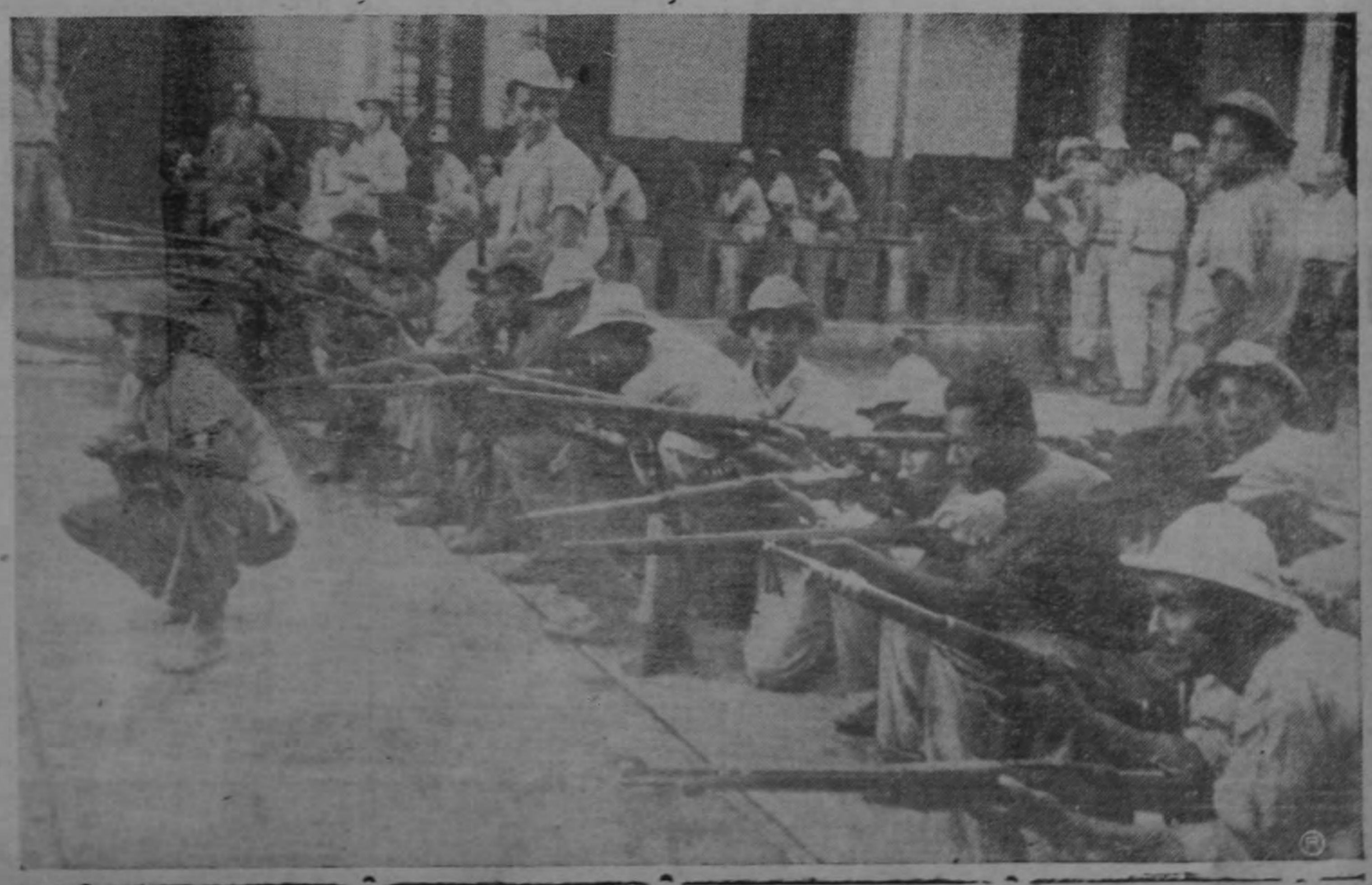
Los por entru es. Los bres trabajadores engañados dirigentes eran obligados a arse para matar costarricen- as de 2.000 de ellos pagaron sus vidas este engaño...